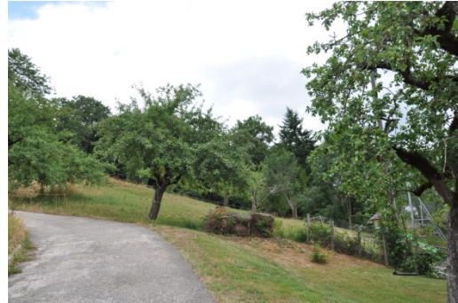
Vergers haute-tige à restaurer dans le village