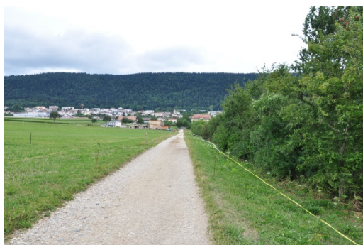
Chemin en chaille – haie existante