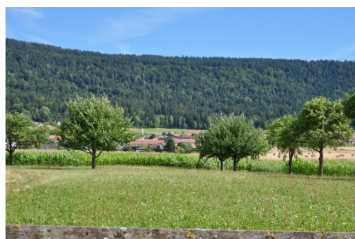
Vergers existant en limite du village