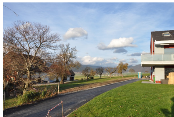
Vue sur des vergers en entrée du village, Saules