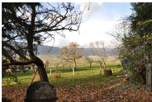
Verger à restaurer - Saules

Les villages de Saules et Vilars font partie des villages de la Côtère avec des structures paysagères encore très présentes valorisables dans le cadre du projet de « Frange urbaine »,