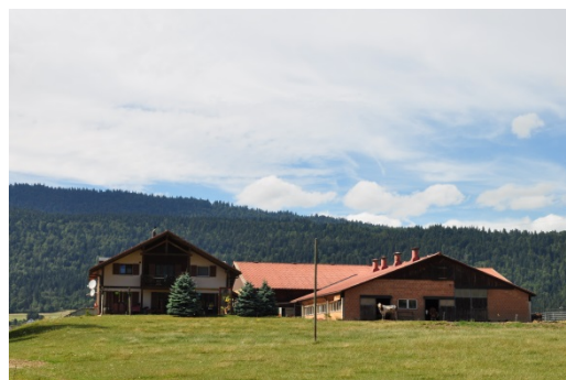
Ferme de colonisation en périphérie du village