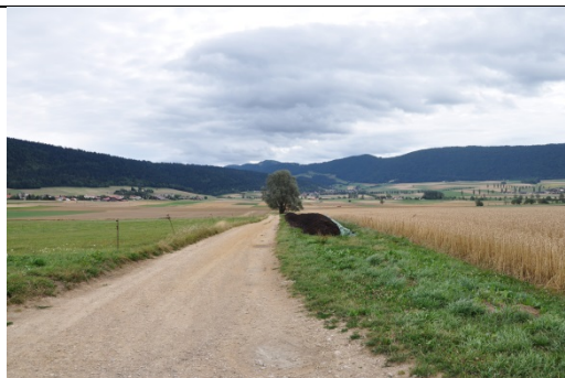
Chemin en chaille – Sortie du bois de Yé