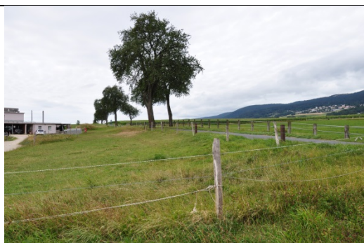
Allée d'arbres existante à renforcer – Route de Chézard