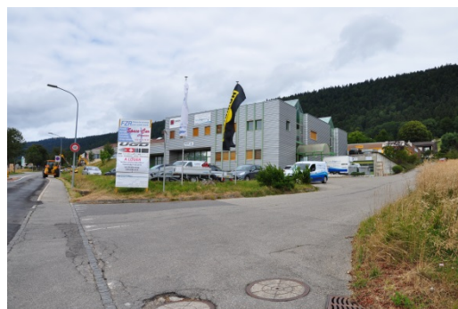
Zone industrielle à améliorer – Gestion espace vert