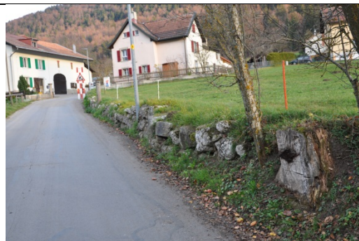
Mur en pierres sèches à Vilars