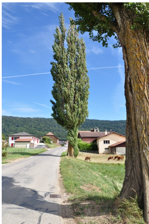
Allée d'arbres existante – Entrée nord du village

Le village de Savagnier est l'un des villages phares de la Côtière (selon classification du plan directeur régional). Il a encore une présence très marquée de structures paysagères diversifiées (jardins, vergers, allées d'arbres). Ce village ne comprend que peu d'entreprises. Plusieurs grandes fermes implantées aux entrées du village pourraient être mieux intégrées paysagèrement. La commune souhaite maintenir l'image de ce village, objectif que peut aisément soutenir le projet « Frange urbaine » .