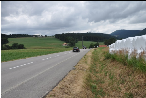
Zone potentielle pour une allée d'arbres à l'entrée Ouest