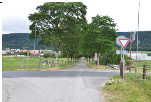
Mobilité douce – Route de Chézard