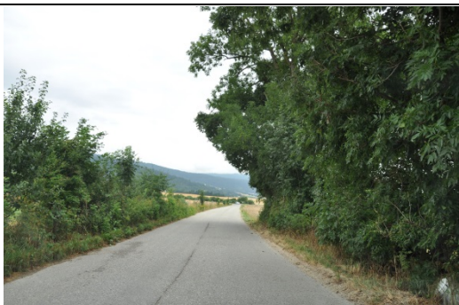
Chemin du cimetière, allée d'arbres existante