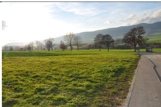
Allée d'arbres reliant les deux villages