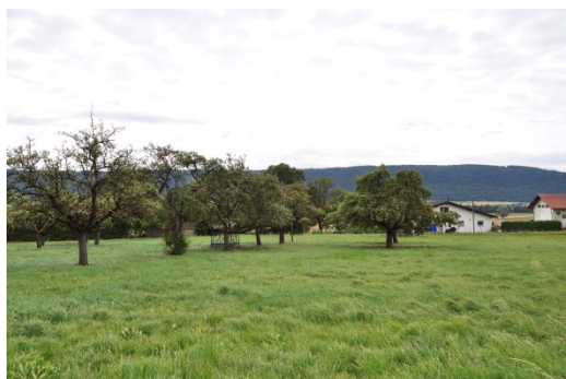
Vergers à restaurer - Chemin des Morgiers

Le secteur de Cernier comprend principalement le site d'Evologia et de l'EMTN – école des métiers de la terre et de la nature. Le périmètre offre une multitude de possibilités de par sa fonction pédagogique. Le service de l'agriculture en collaboration avec ses différents partenaires présents sur le site a élaboré un premier projet pour la mesure A2, présenté en annexe de ce dossier.