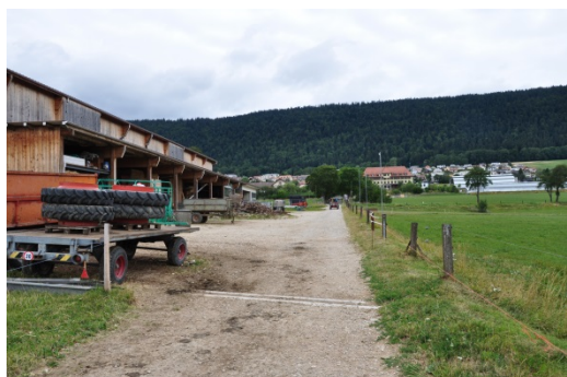
Chemin de Chézard – croisement avec Evologia

Plusieurs tronçons qui relient Cernier à la piscine d'Engollon sont potentiellement intéressants pour en faire une voie verte.