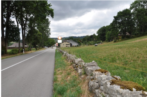
Mur en pierres sèches à l'entrée Est

Porte d'entrée du Val-de-Ruz, Le Pâquier présente un bel exemple de village-rue avec de belles fermes traditionnelles. Le village présente aussi des caractéristiques paysagères particulières (murs en pierres sèches, fontaines, vergers en bordure de villages, haies).