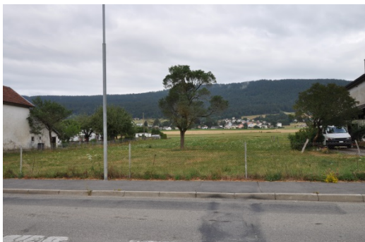
Chemin de l'Abrevieux, verger potentiel

Coffrane, classé village de la plaine, se présente sous forme d'un petit village, et constitue l'axe principal entre le Val-de-Ruz et le village de Rochefort. Les grandes activités industrielles des carrières environnantes impliquent une circulation dense. Les zones de transition entre milieu urbain et agricole pourraient être valorisées et nécessitent un traitement particulier dans le cadre de ce projet.