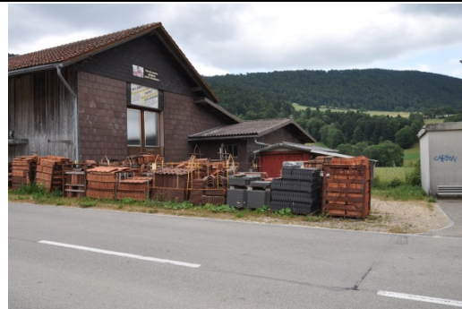
Zone potentielle d'intégration paysagère à l'entrée Ouest