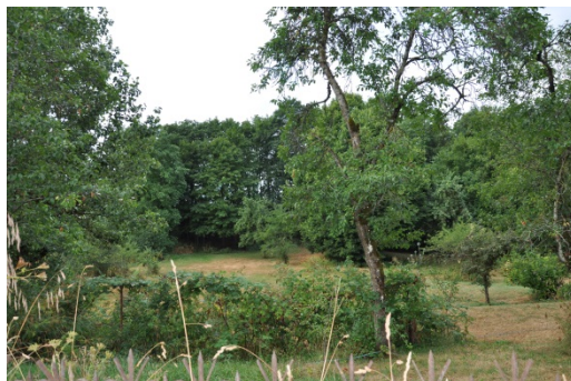
Chemin de la Dime, verger à restaurer