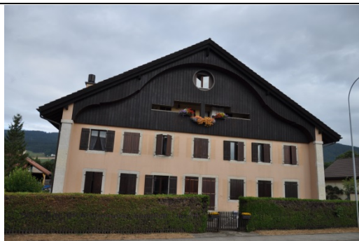
Beau bâtiment au centre du village