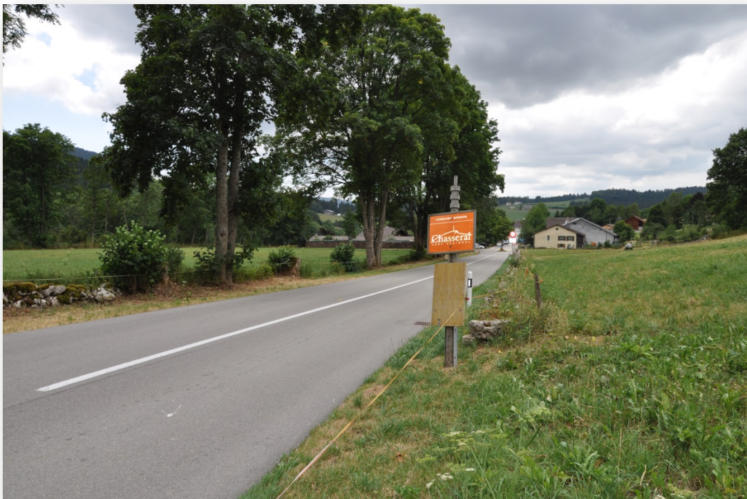
Figure 1: Entrée du village du Pâquier avec ses murs en pierres sèches

Liaisons, espaces de transition et lieux de rencontre au Val-de-Ruz Rapport de présentation