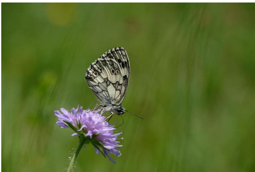
Légende : Le demi-deuil apprécie les surfaces herbeuses et fleuries.